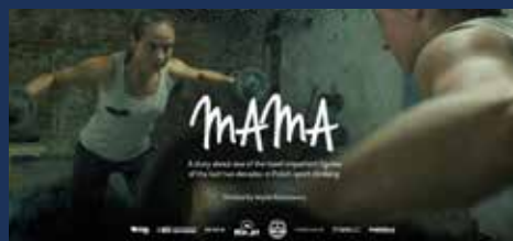
„Mój Czas” W konkursie 2017 – 13. Spotkania z Filmem Górskim 2017, reż.: Jan Wierzejski Polska 2016,