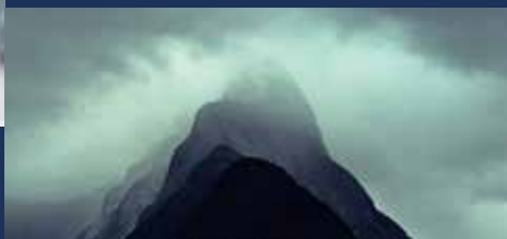
„Dreamland” Nagroda dla filmu polskiego 14. Spotkania z Filmem Górskim 2018, reż.: Stanisław Berbeka, Produkcja: YakYak, Polska 2018, 86 min.