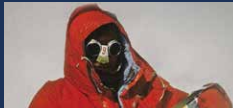
„Sztuka wolności” Grand Prix 8. Spotkania z Filmem Górskim 2012, reż.: Wojciech Słota, Marek Kłosowicz, Polska 2011, 70 min.