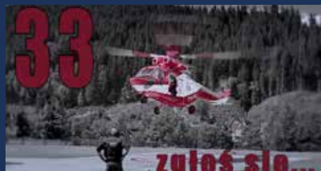
„Pod Ciężarem Wolności” Grand Prix 12. Spotkania z Filmem Górskim 2016, Reżyseria: Pavol Barabas Słowacja 2016, 45 min.